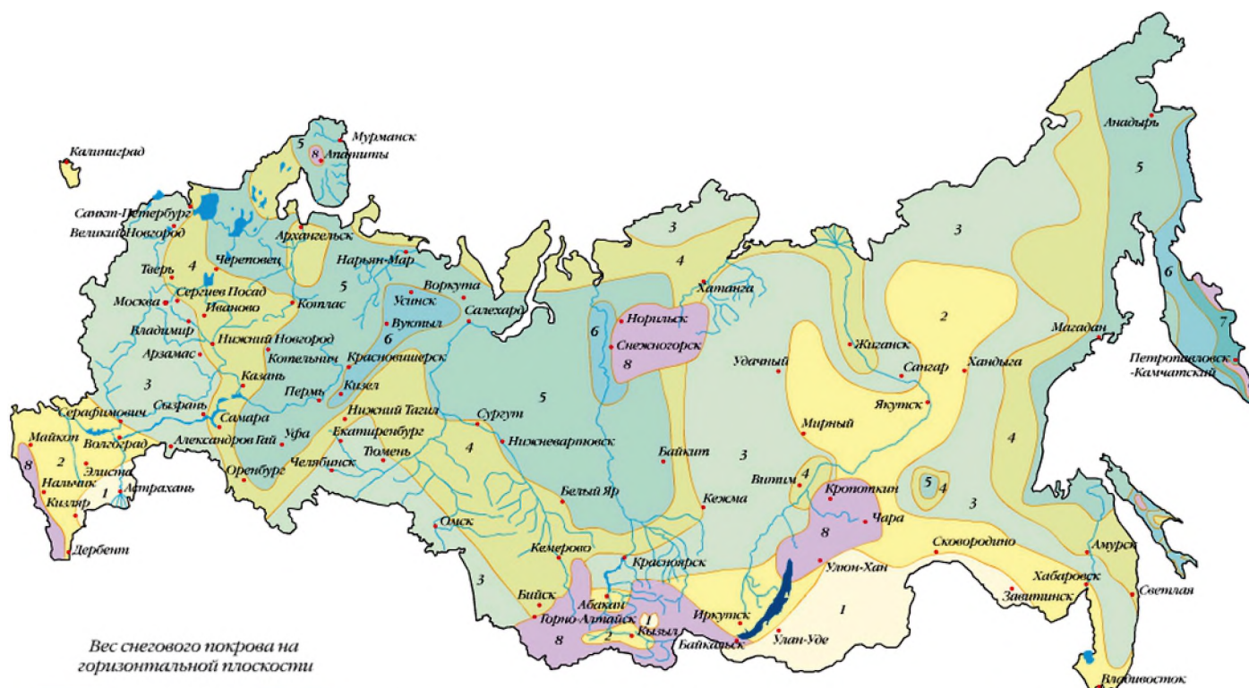
Вес снегового покрова на горизонтальной плоскости