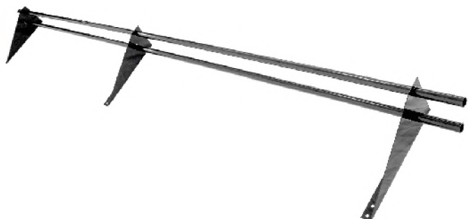
Снегозадержатель 3 м